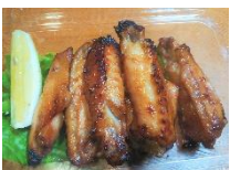
手羽先スタミナ焼 ¥600