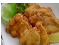
鶏塩唐揚げ 5個 ¥600

炒ったおかか入りの栃木産米使用の大きな 焼きおにぎり(2個入) ※冷凍品もあります