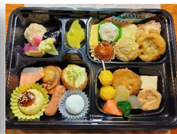
31cm×22cm×5cm 箱膳 2,600円