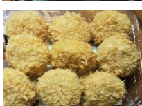
自家製ミニコロッケ ¥630