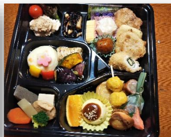
27cm×27cm×5cm 箱膳 3,200円