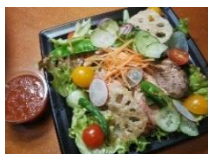
鶏柚子胡椒焼サラダ ¥750