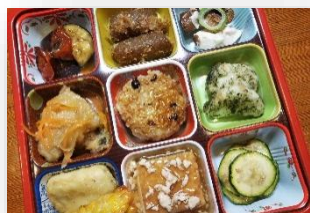
21cm×21cm×4cm このえ 1,400円