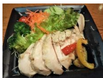
和風鶏ハムサラダ ¥650